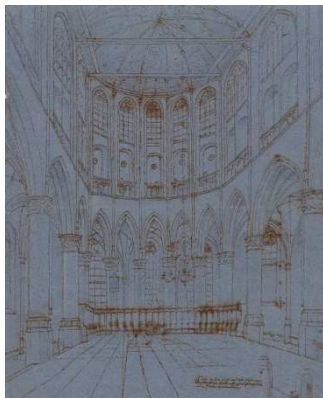
Interieur van de Grote of Sint-Laurenskerk te Alkmaar, gezien vanuit het schip naar het oosten

Collectie Museum Catharijneconvent, Utrecht