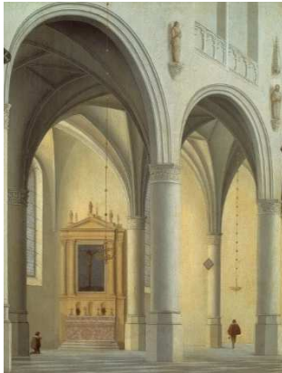
Gezicht op een kapel in de noordelijke zijbeuk van de Grote of Sint-Laurenskerk te Alkmaar