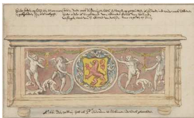
Graftombe van Floris V in de Grote of Sint-Laurenskerk te Alkmaar

Collectie Kupferstichkabinett, Staatliche Museen zu Berlin, Berlijn