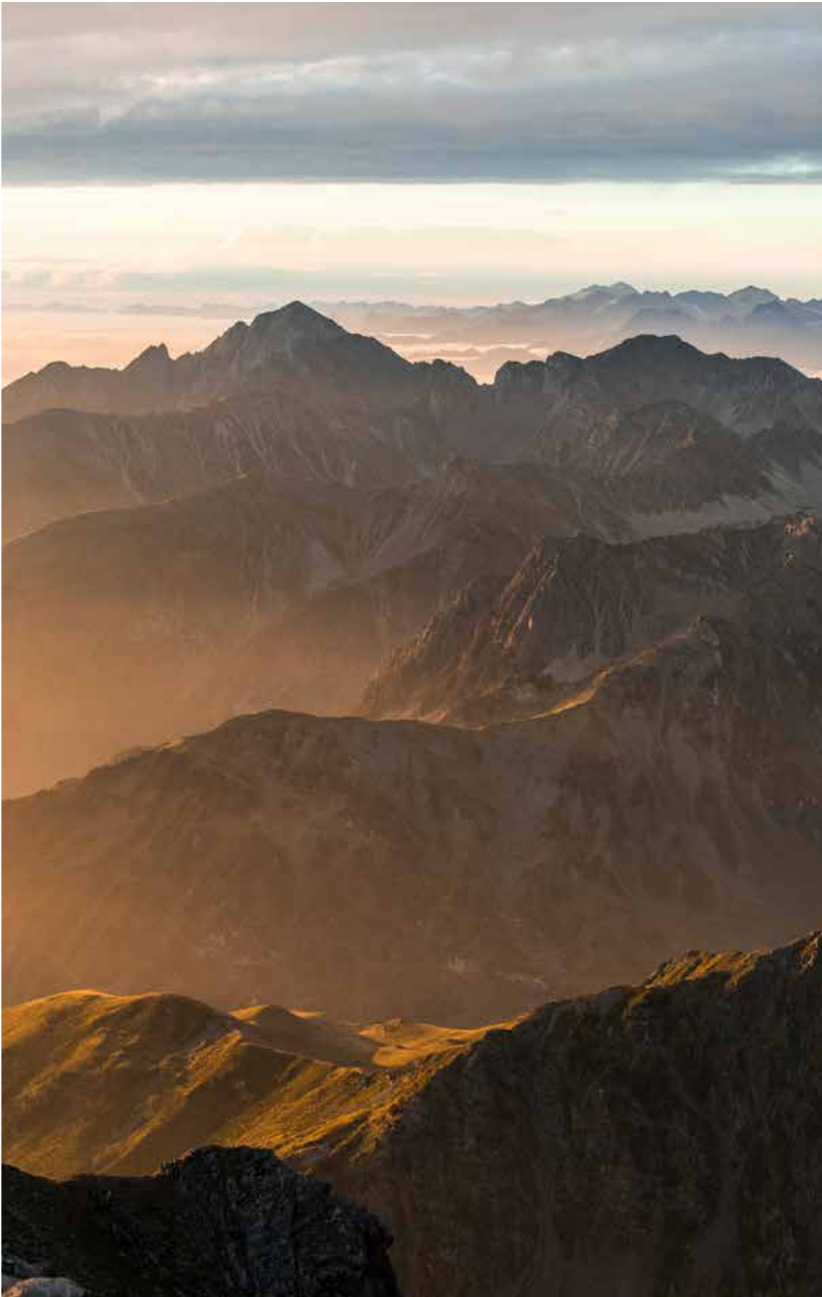
Overpeinzing, bossen, uitzicht